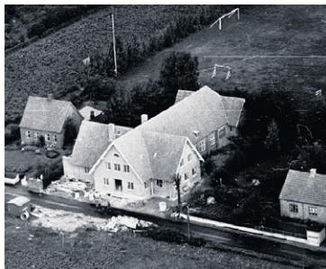
Indslev Tårup forsamlingshus 1948