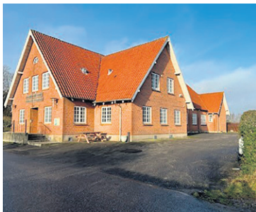
Indslev Tårup forsamlingshus 2023

Bestyrelsen for Indslev Tårup Forsamlingshus